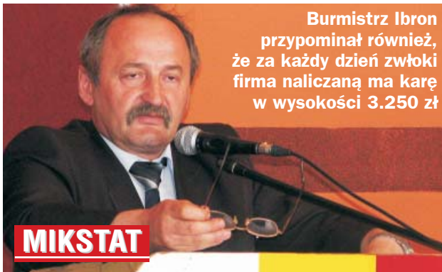
Burmistrz Ibron przypominał również, że za każdy dzień zwłoki firma naliczana ma karę w wysokości 3.250 zł

Wykonawca zobowiązał się, że prace zakończy do