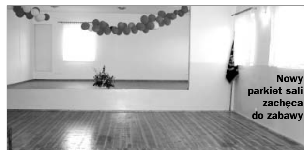
Nowy parkiet sali zachęca do zabawy

Efekty zakończonych prac remontowo - wykończeniowych można podziwiać na załączonych zdjęciach. W tym numerze prezentujemy salę w Bledzianowie i Szklarce Przygodzickiej. Kolejne miejscowości przedstawimy w następnych wydaniach Informacji Samorządowych. Mamy nadzieję, że odnowione i zmodernizowane lokale będą służyć społeczności lokalnej.