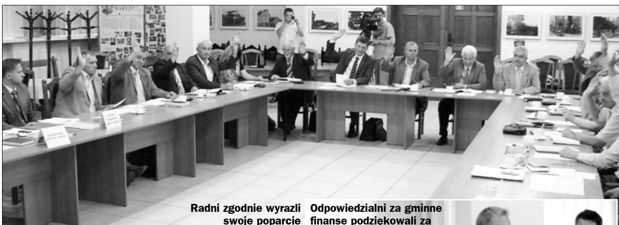
Radni zgodnie wyrazili swoje poparcie