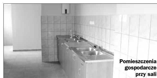
Pomieszczenia gospodarcze przy sali