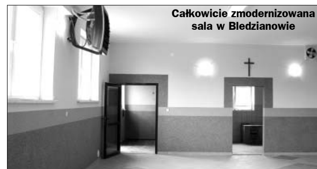
Całkowicie zmodernizowana sala w Bledzianowie