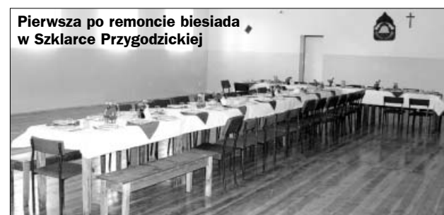
Pierwsza po remoncie biesiada w Szklarce Przygodzickiej

Rada Miejska Ostrzeszów w ubiegłym roku podjęła dwie uchwały: uchwałę Nr XXXV/259/2010 w sprawie zatwierdzenia Planów Odnowy Miejscowości Bledzianów, Korpisy, Szklarka Mysłniewska, Szklarka Przygodzicka na lata 2010-2017, oraz uchwałę Nr XXXVI/264/2010 w sprawie zatwierdzenia Planu Odnowy Miejscowości Olszyna na lata 2010-2017. Kolejnym etapem było złożenie wniosku o dofinansowanie ze środków unijnych remontu sal wiejskich w ww. miejscowościach, który został oceniony pozytywnie, dzięki czemu Miasto i Gmina Ostrzeszów uzyskała wsparcie finansowe z Programu Rozwoju Obszarów Wiejskich na lata 2007 – 2013.