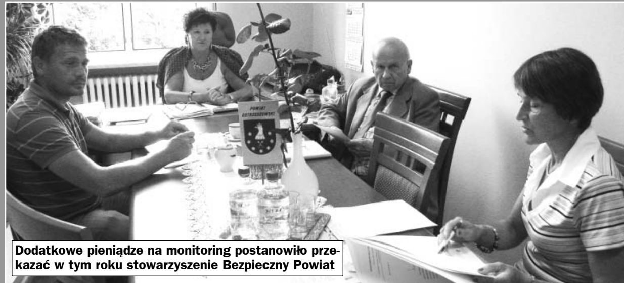
Dodatkowe pieniądze na monitoring postanowiło przekazać w tym roku stowarzyszenie Bezpieczny Powiat

Najpewniej w połowie listopada br. Ostrzeszów objęty zostanie monitoringiem wizyjnym. Cała inwestycja już od kilku lat odwleka się w czasie, ale nie z powodów finansowych, jak można byłoby przypuszczać, a organizacyjnych. Ani policja, ani straż nie chcą, aby monitory zlokalizowane były właśnie u nich.