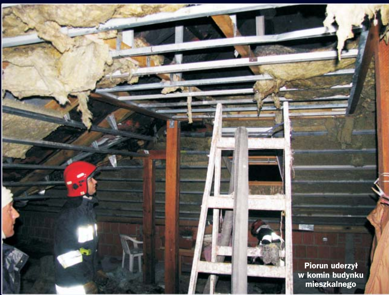
Piorun uderzył w komin budynku mieszkalnego

W Ostrzeszowie piorun uderzył w komin budynku mieszkalnego, powstały ogień częściowo spalił więźbę dachową i dach. W Raclawicach (gm. Kraszewice) od pioruna zapaliło się siano i stare maszyny rolnicze. To skutki burz, jakie w minionym tygodniu przeszły nad powiatem ostrzeszowskim. W Mikstacie nieznan sprawca podpalił drewnianą stodołę.