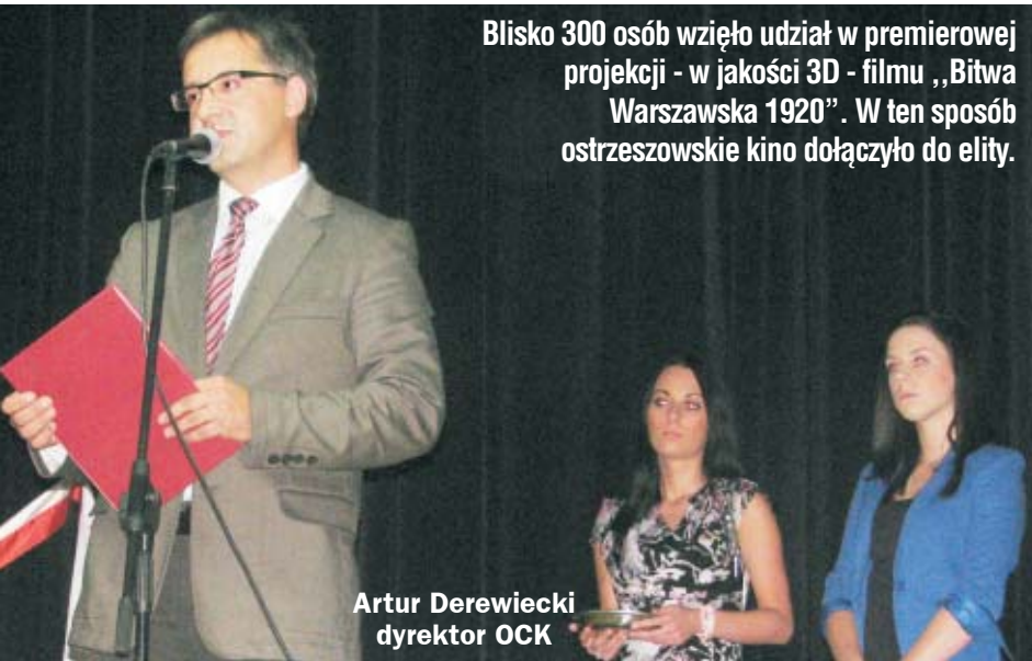
Blisko 300 osób wzięło udział w premierowej projekcji - w jakości 3D - filmu „Bitwa Warszawska 1920”. W ten sposób ostrzeszowskie kino dołączyło do elity.