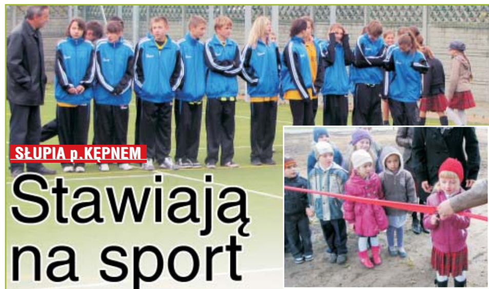
ŚLUPIA p. KEPNEM