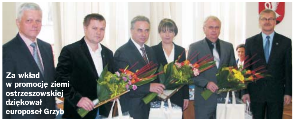
Za wkład w promocję ziemi ostrzeszowskiej dziękował europoseł Grzyb