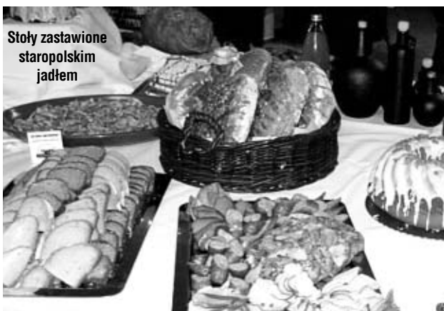
Stoły zastawione staropolskim jadłem

Radosna atmosfera, w którą wprowadziła zebranych kapela ludowa „Furmany” z Gorzyc Wielkich, tańce, opróżnione talerze i około 800 ugoszczonych osób najlepiej świadczy o sukcesie akcji promocyjnej. Mamy nadzieję, że dzięki tym staraniom Bruksela usłyszy o bogactwie i pięknie Południowej Wielkopolski, a w tym Ziemi Ostrzeszowskiej.