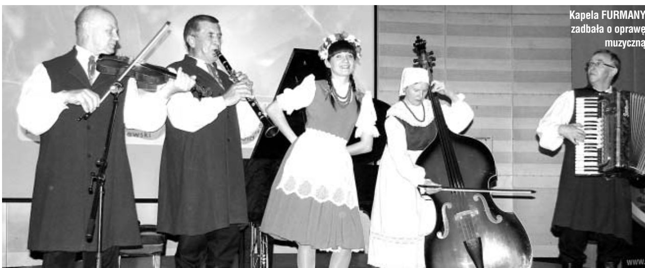
Kapela FURMANY zadbała o oprawę muzyczną