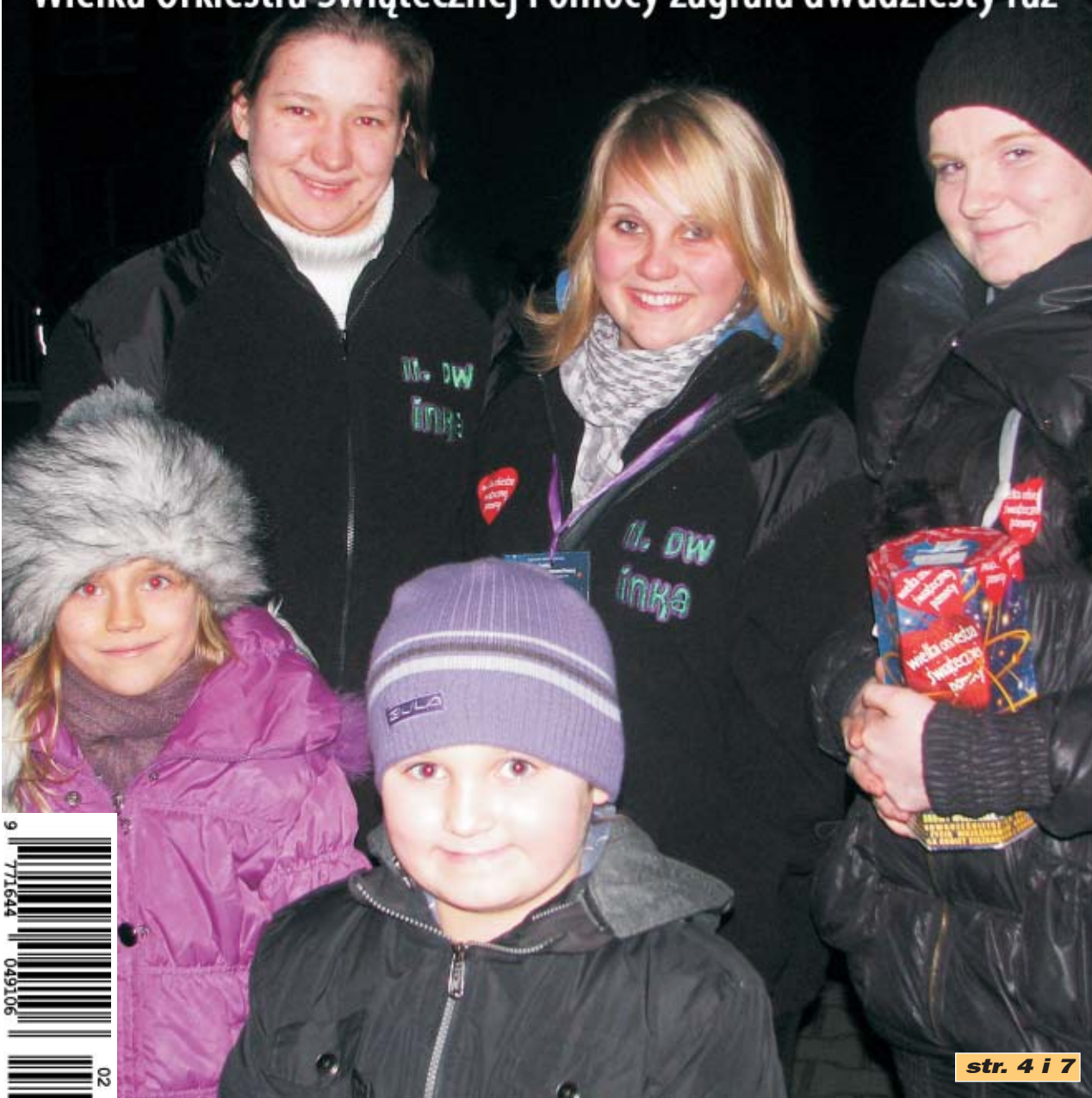
str. 4 i 7

Wielka Orkiestra Świątecznej Pomocy zagrała dwudziesty raz