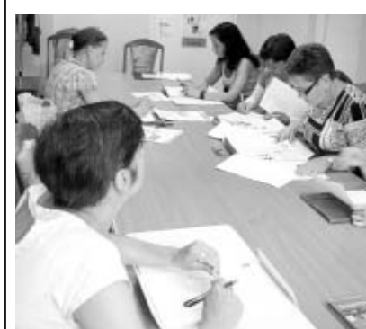
Uczestniczki kursu jęz. angielskiego