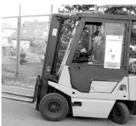
Kurs obsługi wózka widłowego