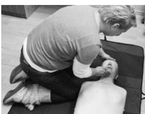
Beneficjenci nabyli nowe umiejętności zawodowe