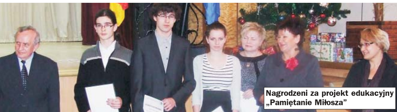
Nagrodzeni za projekt edukacyjny „Pamiętanie Miłozza”

Apelem pamięci oraz złożeniem wieńców przed obeliskiem uczcili 93. rocznicę wybuchu Powstania Wielkopolskiego uczniowie i nauczyciele Zespołu Szkół nr 1 w Ostrzeszowie. Wręczono także nagrody za projekt edukacyjny „Pamiętanie Miłozza”.