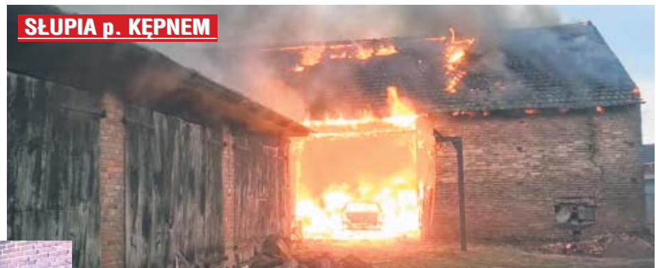
SŁUPIA p. KĘPNEM