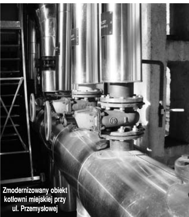
Zmodernizowany obiekt kotłowni miejskiej przy ul. Przemysłowej