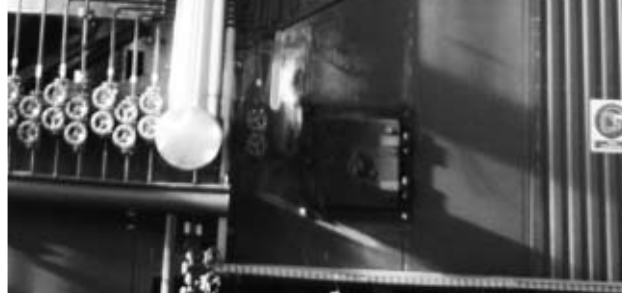
Z tego miejsca można sterować pracą całej kotłowni