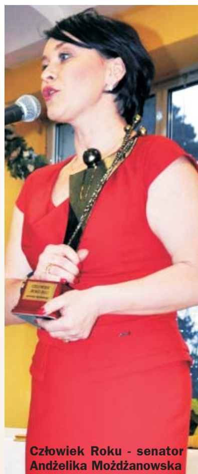
Człowiek Roku - senator Andżelika Możdzanowska