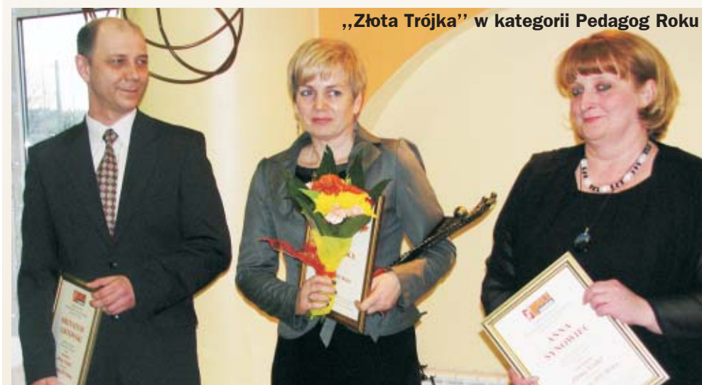
„Złota Trójka” w kategorii Pedagog Roku