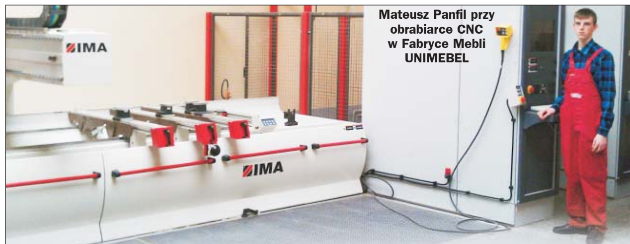
Mateusz Panfil przy obrabiarce CNC w Fabryce Mebli UNIMEBEL

W sobotę 10 marca 2011 roku w Zespole Szkół Budowlano-Drzewnych w Poznaniu odbył się okręgowy etap Turnieju Budowlanego „ZŁOTA KIELNIA” w zawodach budowlanych: murarz, malarz-tapeciarz, stolarz, monter instalacji i urządzeń sanitarnych. Uczniowie Zespołu Szkół Nr 1 w Ostrzeszowie, Łukasz Mielnik i Mateusz Panfil, odbywający praktyczną naukę zawodu w Fabryce Mebli UNIMEBEL, zajęli równorzędnie pierwsze miejsce na eliminacjach okręgowych i zakwalifikowali się do Finału Centralnego Ogólnopolskiego Turnieju Budowlanego „Złota Kielnia”.