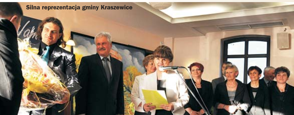
Silna reprezentacja gminy Kraszewice