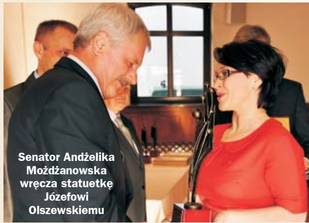
Senator Andżelika Możdżanowska wręcza statuetkę Józefowi Olszewskiemu