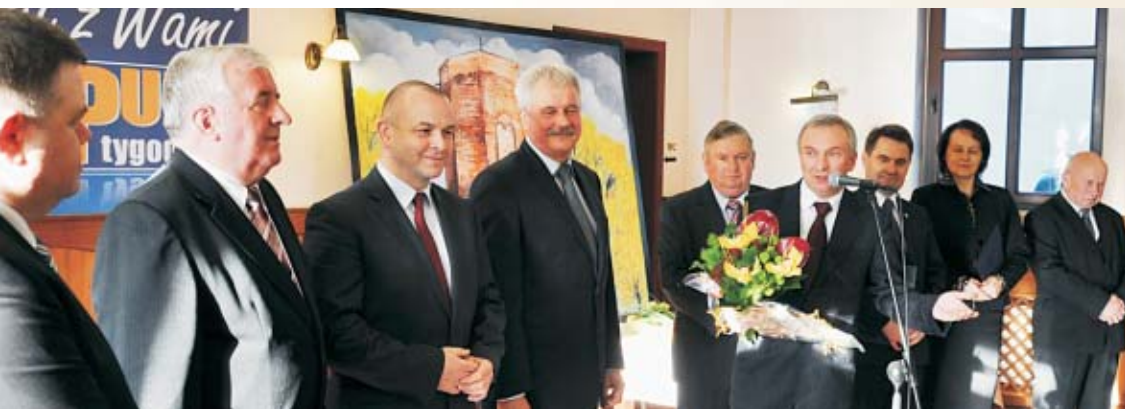
Redaktor naczelny odbiera gratulacje od wódatrzy miast i gmin