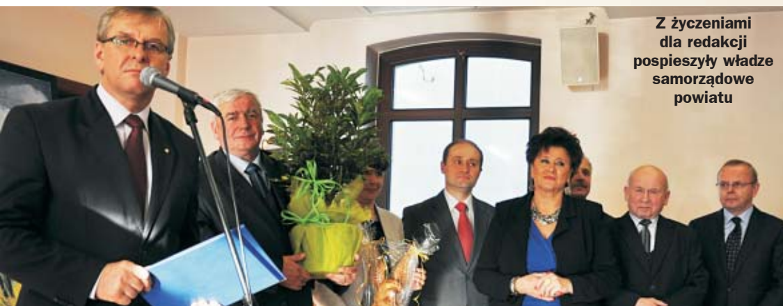
Z życzeniami dla redakcji pospieszły władze samorządowe powiatu