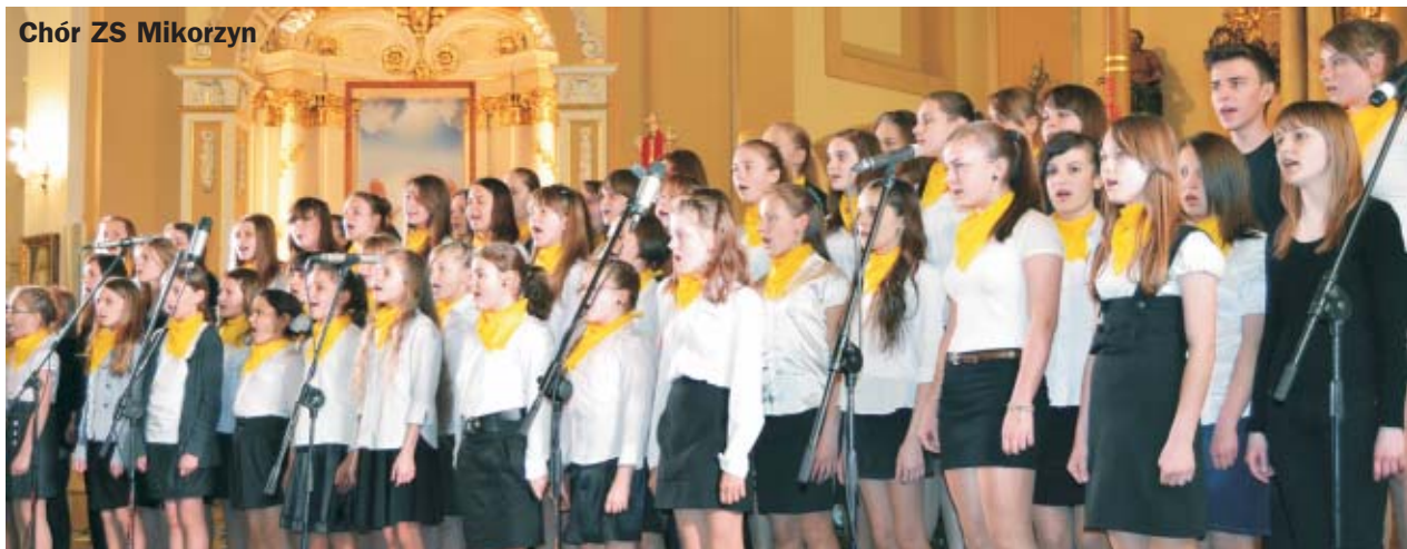
Chór ZS Mikorzyn