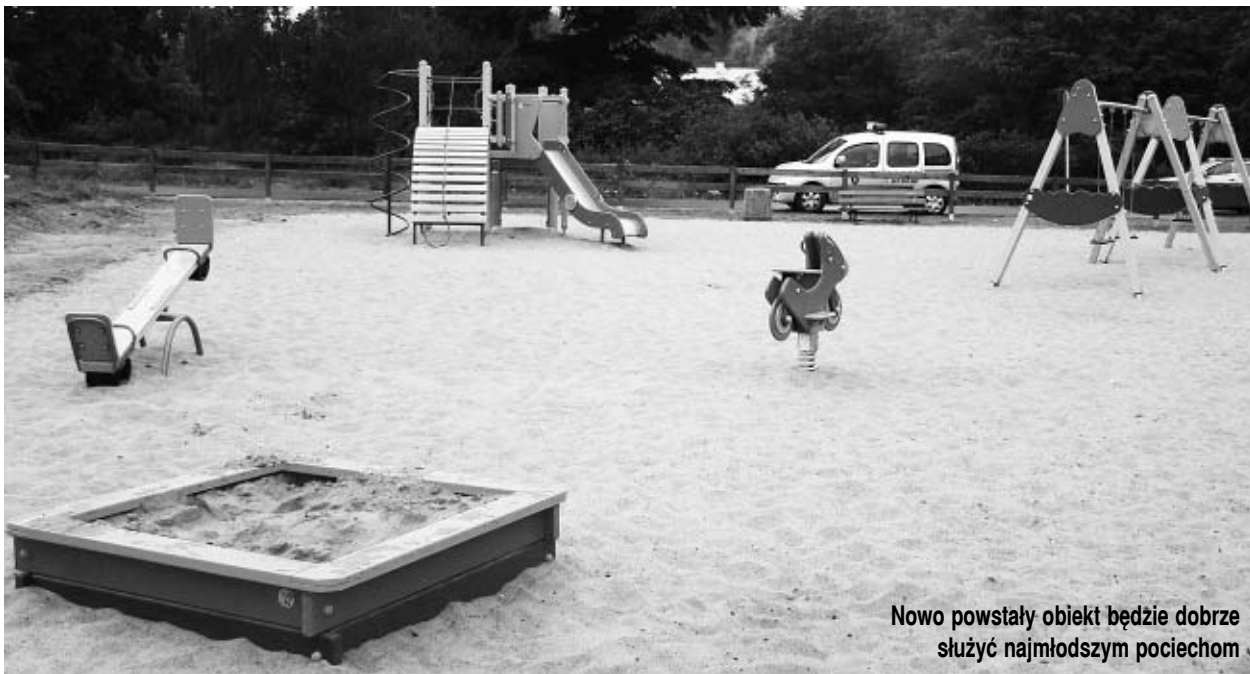
Nowo powstały obiekt będzie dobrze służyć najmłodszym pociechom