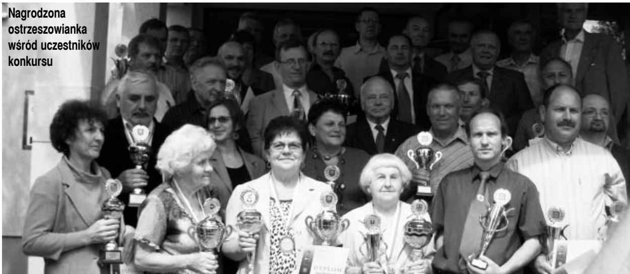
Nagrodzona ostrzeszowianka wśród uczestników konkursu