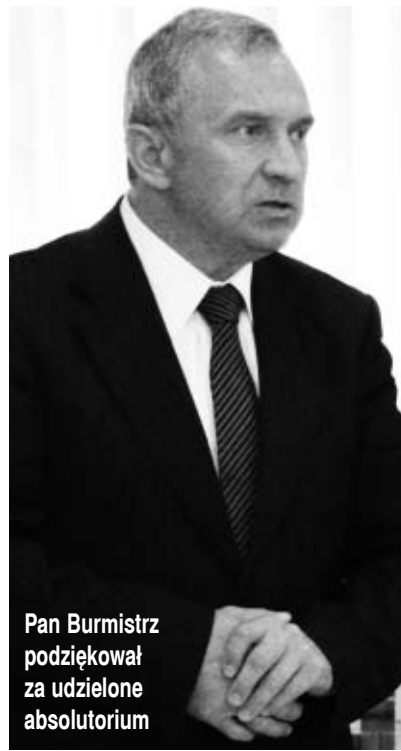
Pan Burmistrz podziękował za udzielone absolutorium

Rada Miejska była zgodna w sprawie poparcia dla wykonania budżetu