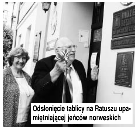
Odsłonięcie tablicy na Ratuszu upamiętniającej jeńców norweskich