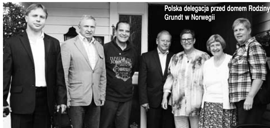
Polska delegacja przed domem Rodziny Grundt w Norwegii

Żona zmarłego zapewniła, że współpraca i przyjaźń z Ostrzeszowem nawiązana dzięki staraniom Jej męża będzie nadal kontynuowana.