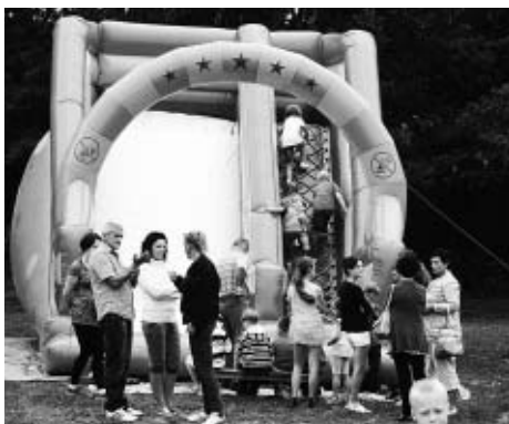
Nie zabrakło atrakcji dla najmłodszych