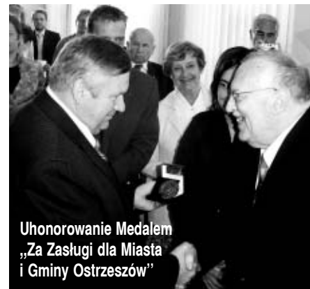
Uchonorowanie Medalem „Za Zasługi dla Miasta i Gminy Ostrzeszów”