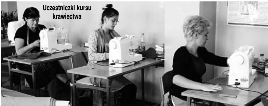
Uczestniczki kursu krawiectwa

Miejsko-Gminny Ośrodek Pomocy Społecznej w Ostrzeszowie w 2012 roku po raz kolejny przystąpił do realizacji projektu systemowego „Inwestuję w siebie”, który jest realizowany w ramach Programu Operacyjnego Kapitał Ludzki-Działanie 7.1 Rozwój i upowszechnianie aktywnej integracji, Poddziałanie 7.1.1 Rozwój i upowszechnianie aktywnej integracji przez ośrodki pomocy społecznej. Jest to już piąta edycja w/w projektu.