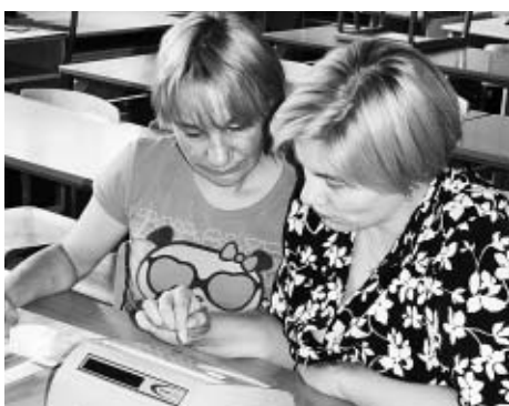
Podczas kursu „Profesjonalny handlowiec”