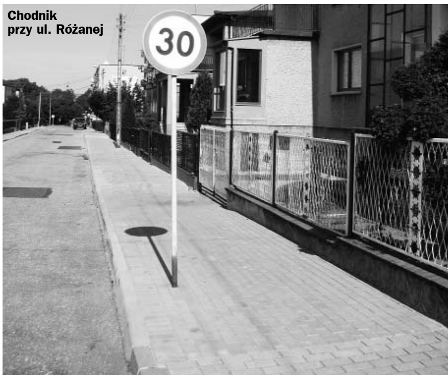
Chodnik przy ul. Różanej