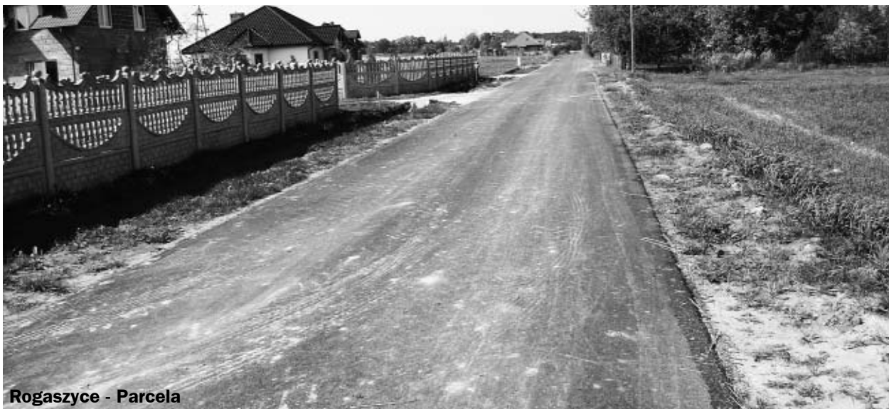
Rogaszyce - Parcela

Nowo wybudowana droga o długości 970 m cieszy mieszkańców miejscowości Marydół, którzy do tej pory korzystali z drogi gruntowej udając się w kierunku Marydół - Huta. Koszt realizacji tej inwestycji wyniósł ok. 235.000 zł. Nową nawierzchnią drogi mogą pochwalic się również mieszkańcy Rogaszyce - Parcela. Na 750 m odcinek drogi wydano z budżetu MiG ok. 244.000 zł.