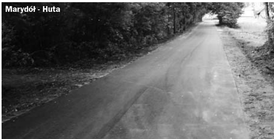
Marydół - Huta

Wydział Inwestycji i Gospodarki Komunalnej UMiG informuje, że w najbliższym czasie zostanie przebudowana ul. Krańcowa i wyremontowana ul. Dworcowa (na odcinku ul. Kolejowa - Dworzec PKP). Dodatkowo planuje się wykonanie: nakładki na ul. Marciniaka i drogi dojazdowej do odrestaurowanego kościoła Św. Mikołaja, chodnika przy ul. Przemysłowej oraz dalszej części przy ul. Różanej, a w ramach współdziałania z Generalną Dyрекcją Dróg Krajowych i Autostrad - przedłużenie chodnika wzdłuż drogi krajowej nr 11 (od Firmy „DROP” w kierunku Rogaszyce).