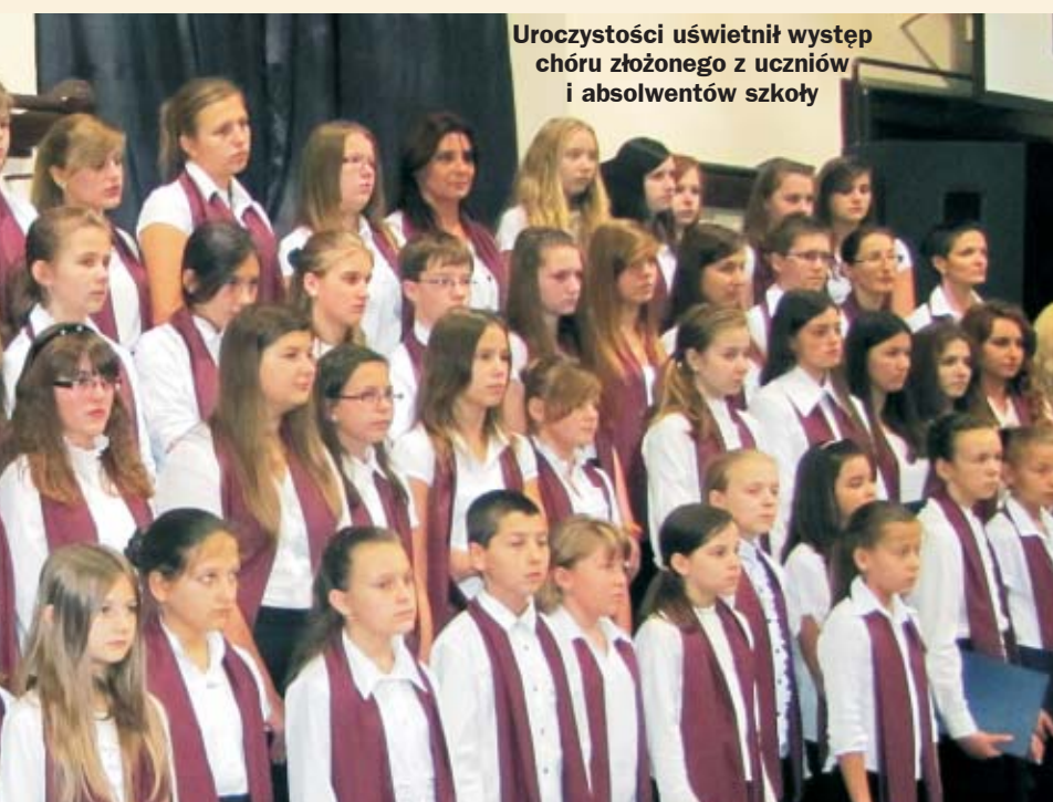
Uroczystości uświetnił występ chóru złożonego z uczniów i absolwentów szkoły