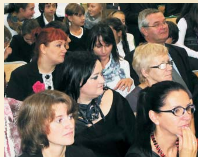
Wśród zaproszonych gości pojawiła się absolwentka szkoły, jedna z czołowych polskich projektantek mody Gosia Baczyńska (na zdjęciu w środku)