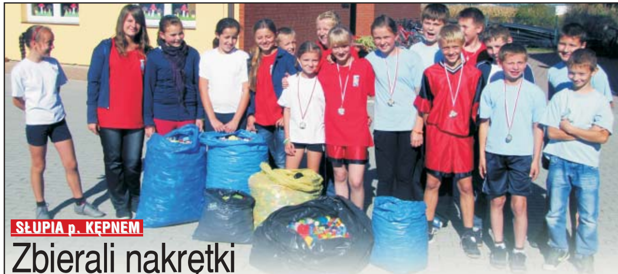
SŁUPIA p. KEPNEM