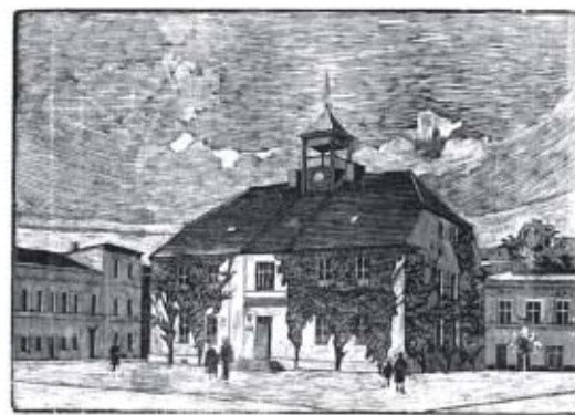
Artur Serbeński - Rynek w Ostrzeszowie, papier, drzeworyt.

Ostrzeszowskie Centrum Kultury - Muzeum Regionalne Koło Polskiego Związku Filatelistów