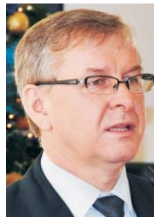
Janicki: - To radni wymusili inwestycje na takim poziomie. Proszę państwa, nie żałujmy tych inwestycji, bo one już są zrobione, one służą. To nie są przejeżdżone pieniądze.