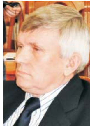
Obsadny: - Pan starosta jest głuchy na krytykę, (...) ciągle próbuje zagłaskać rzeczywistość.