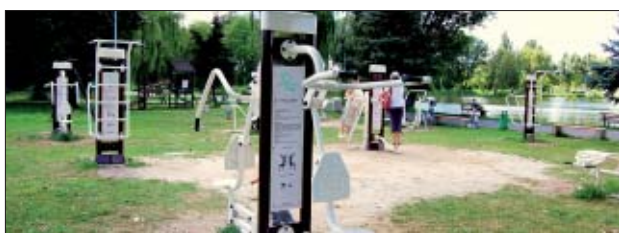
Siłownia zewnętrzna przy KOSiR