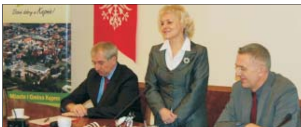
Konferencja prasowa w sprawie dofinansowania remontu „Starego Ratusza”