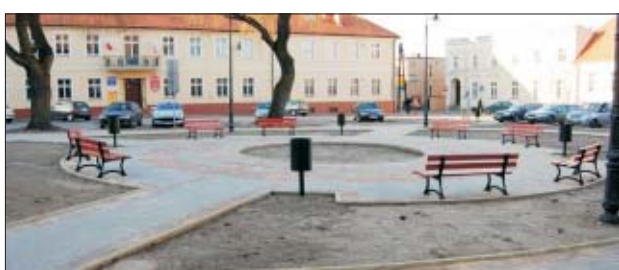
Plac przy ulicy Kościuszki