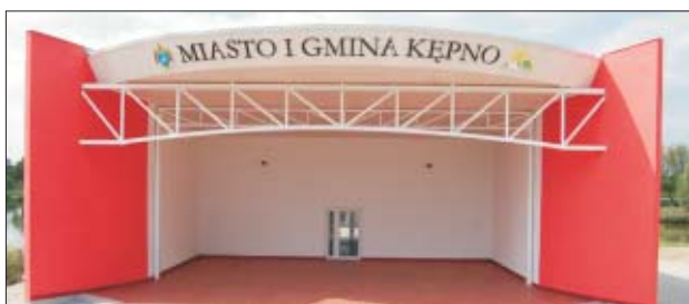
Amfiteatr w Kępnie