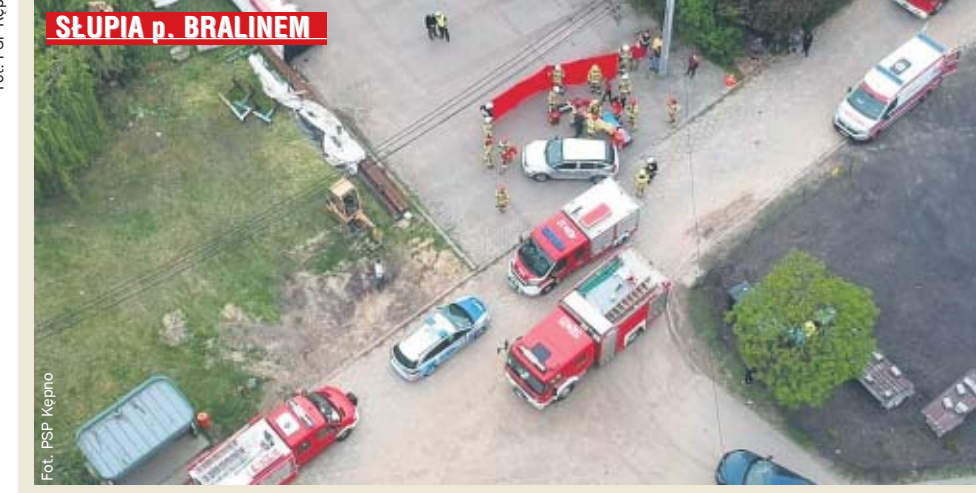
SŁUPIA p. BRALINEM