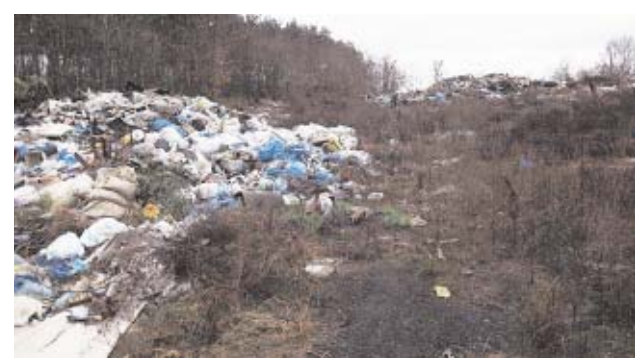
Zdjęcia z rekultywacji składowiska w Gminie Doruchów - przed rekultywacją, w trakcie rekultywacji.

Spółka Inwestor Kępno Sp. z o.o. jest na etapie rekultywacji pierwszych dwóch składowisk. Na składowiskach objętych projektem prowadzone są prace ukształtowania czasy składowiska, wykonanie warstw filtracyjnych, wykonanie odgazowania, następnie warstwy izolacyjnej oraz instalacji drenarskiej. Prace końcowe polegają na wykonaniu okrywy rekultywacyjnej poprzez nawiezienie humusu