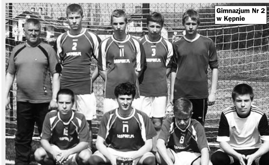
Gimnazjum Nr 2 w Kępnie

18 kwietnia na dwóch „Orlikach” - w Kępnie i Baranowie - odbyły się