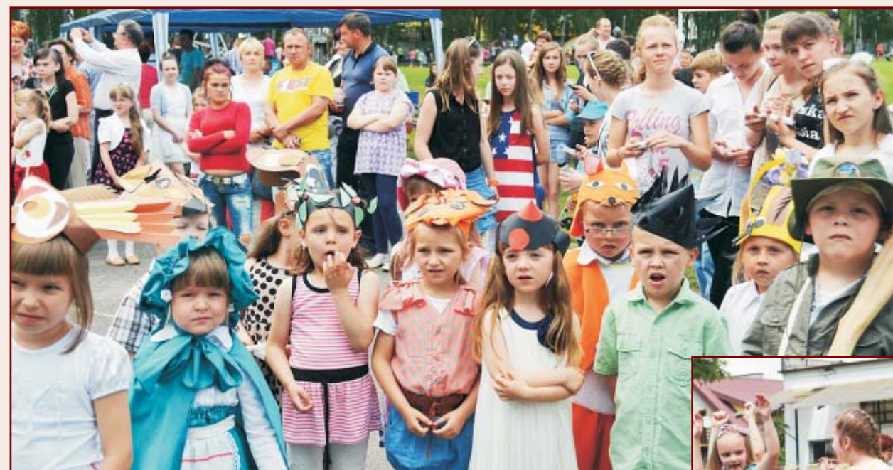
- Występy dzieci, kabaret Masztalskich, koncert Teresy Werner, pokaz sprzętu strażackiego i wojskowego - to w zasadzie główne i jedyne atrakcje obchodzonych w minioną niedzielę XX jubileuszowych Dni Ziemi Mikstackiej. Nie można było narzekać na pogodę... Padać zaczęło dopiero wieczorem.