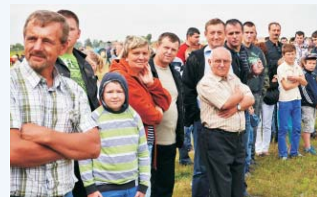
Było odpalanie bombajów, wyciągi, cały czas serwujemy nasze regionalne dania. Dzieje się tutaj bardzo dużo.