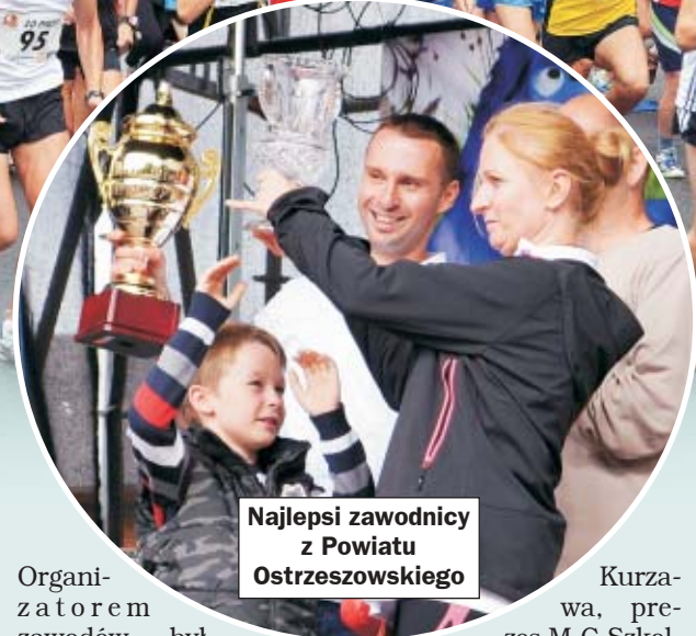
Najlepsi zawodnicy z Powiatu Ostrzeszowskiego

I Profi Bieg Uliczny, to jeden z wielu punktów tegorocznego Festiwalu Pasztetników i Potraw z Gęsi.