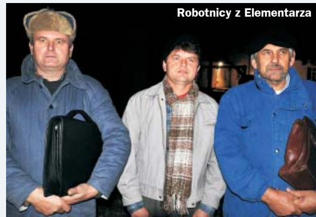
Robotnicy z Elementarza