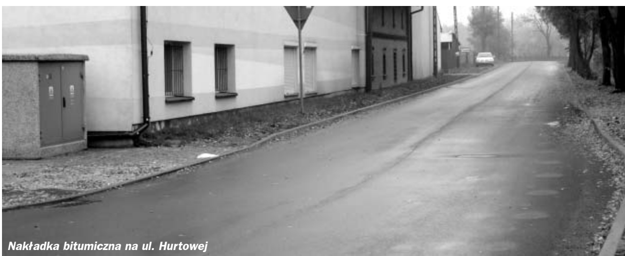
Nakładka bitumiczna na ul. Hurtowej