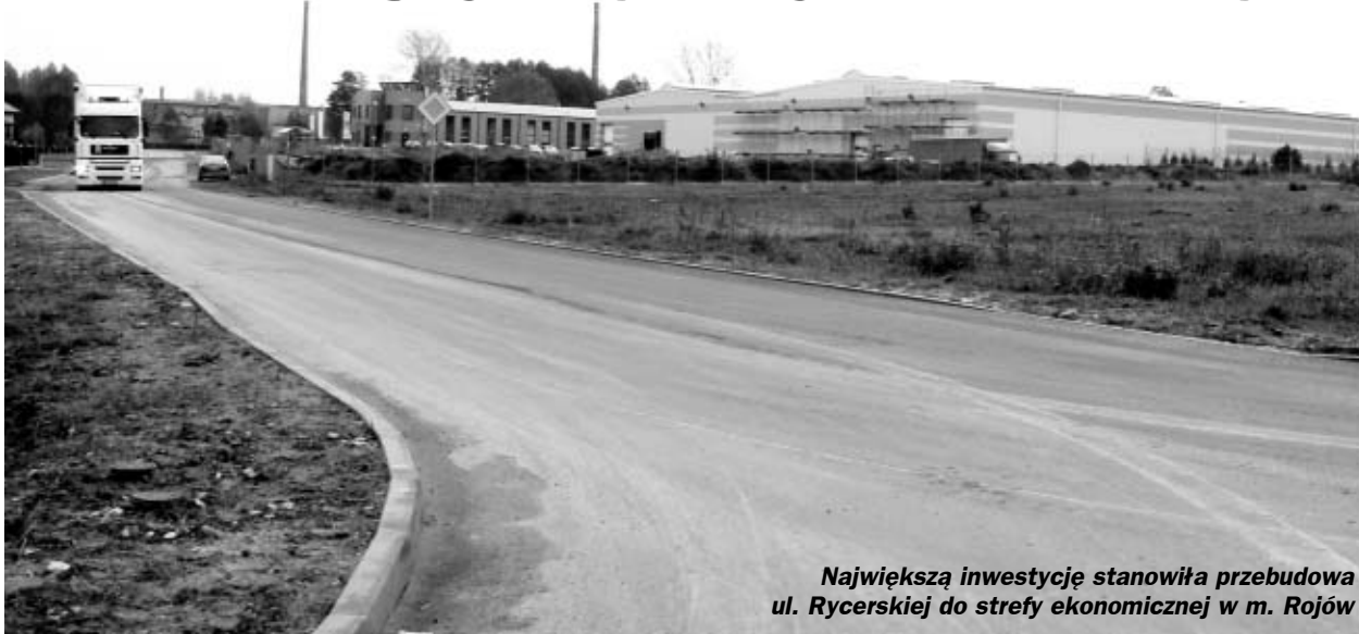
Największą inwestycję stanowiła przebudowa ul. Rycerskiej do strefy ekonomicznej w m. Rojów

Wydział Inwestycji i Gospodarki Komunalnej UMiG informuje o kolejnych zakończonych inwestycjach na drogach gminnych.