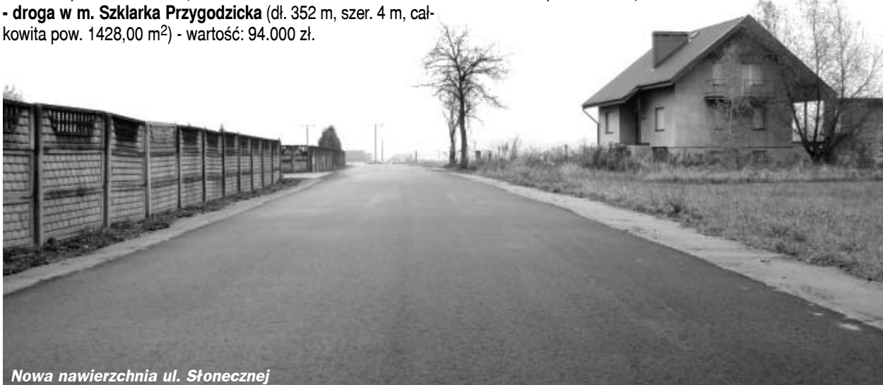
Nowa nawierzchnia ul. Słonecznej