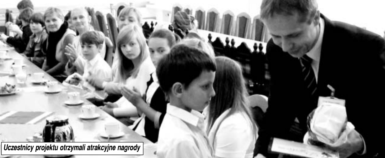
Uczestnicy projektu otrzymali atrakcyjne nagrody

Tegoroczna edycja ogólnopolskiej kampanii „ZACHOWAJ TRZEŻWY UMYSŁ”, podejmującej problem profilaktyki uzależnień, realizowana była pod hasłami: „UNIKAM ZAGROŻEN – DZIEŁĘ SIĘ PIĘKNEM!” – w gimnazjach i „NA TROPIE PIĘKNA!” – w szkołach podstawowych.