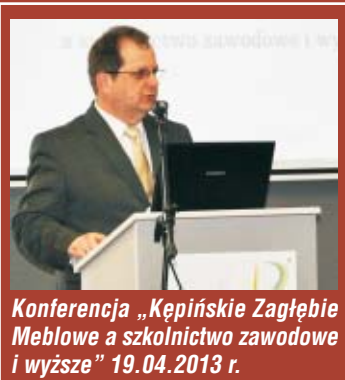
Konferencja „Kępińskie Zagłębienie Meblowe a szkolnictwo zawodowe i wyższe” 19.04.2013 r.