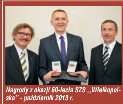
Nagrody z okazji 60-lecia SZS „Wielkopolska” - październik 2013 r.