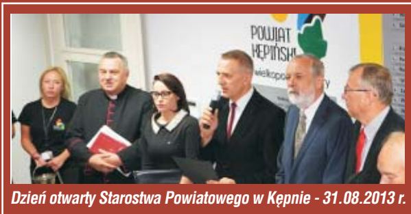
Dzień otwarty Starostwa Powiatowego w Kępnie - 31.08.2013 r.