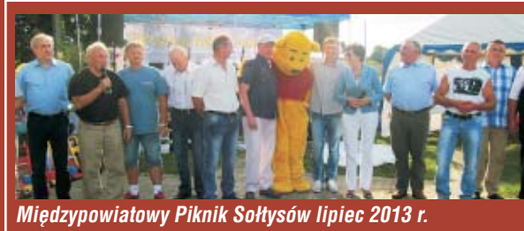
Międzypowiatowy Piknik Sołtysów lipiec 2013 r.