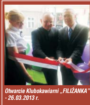
Otwarcie Klubokawiarni „FILIŻANKA” - 26.03.2013 r.