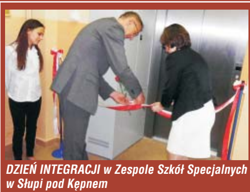
DZIEŃ INTEGRACJI w Zespole Szkół Specjalnych w Słupia pod Kępem