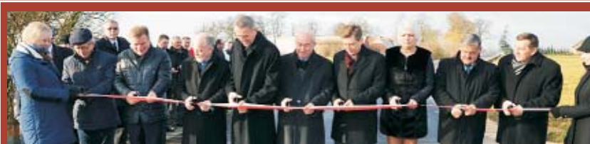
OTWARCIE ZMODERNIZOWANYCH DRÓG POWIATOWYCH NA ODCINKU DARNOWIEC -NOWA WIEŚ KSIĄŻĘCA -KOZA WIELKA