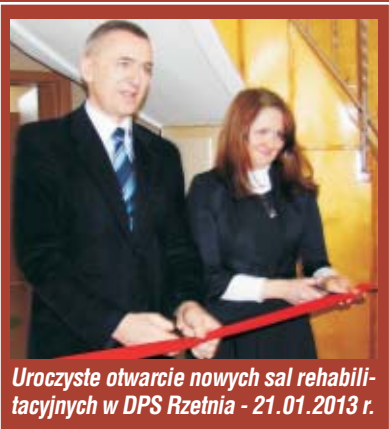
Uroczyste otwarcie nowych sal rehabilitacyjnych w DPS Rzetnia - 21.01.2013 r.