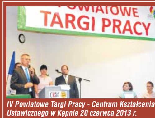
IV Powiatowe Targi Pracy - Centrum Kształcenia Ustawicznego w Kępnie 20 czerwca 2013 r.