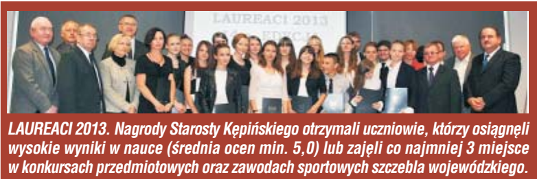
LAUREACI 2013. Nagrody Starosty Kępińskiego otrzymali uczniowie, którzy osiągnęli wysokie wyniki w nauce (średnia ocen min. 5,0) lub zajęli co najmniej 3 miejsce w konkursach przedmiotowych oraz zawodach sportowych szczebla wojewódzkiego.