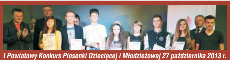
I Powiatowy Konkurs Piosenki Dziecięcej i Młodzieżowej 27 października 2013 r.