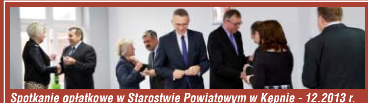
Spotkanie opłatkowe w Starostwie Powiatowym w Kępnie - 12.2013 r.