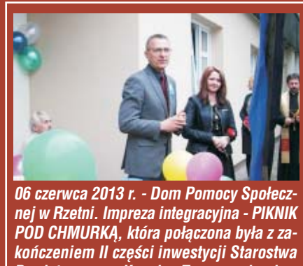
06 czerwca 2013 r. - Dom Pomocy Społecznej w Rzetni. Impreza integracyjna - PIKNIK POD CHMURKĄ, która połączona była z zakończeniem II części inwestycji Starostwa Powiatowego w Kępnie „Termomodernizacja wraz z remontem budynku pawilonu mieszkalnego DPS w Rzetni”.