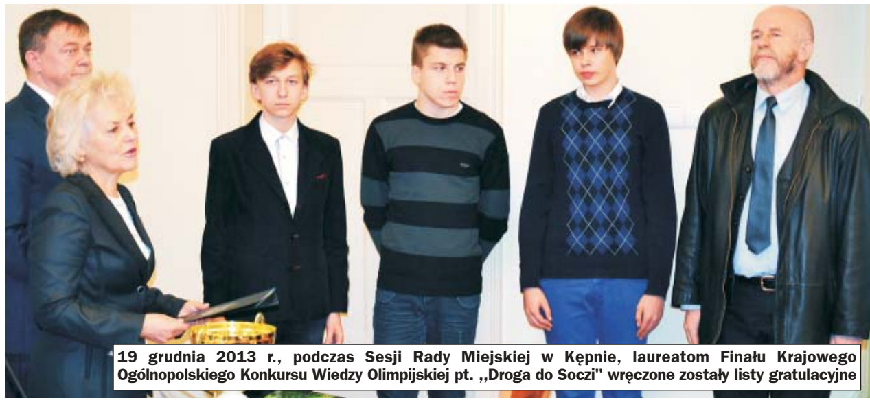
19 grudnia 2013 r., podczas Sesji Rady Miejskiej w Kępnie, laureatom Finału Krajowego Ogólnopolskiego Konkursu Wiedzy Olimpijskiej pt. „Droga do Soczi” wręczone zostały listy gratulacyjne