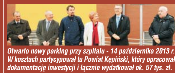
Otwarto nowy parking przy szpitalu - 14 października 2013 r. W kosztach partycypował tu Powiat Kępiński, który opracował dokumentację inwestycji i łącznie wydatkował ok. 57 tys. zł.