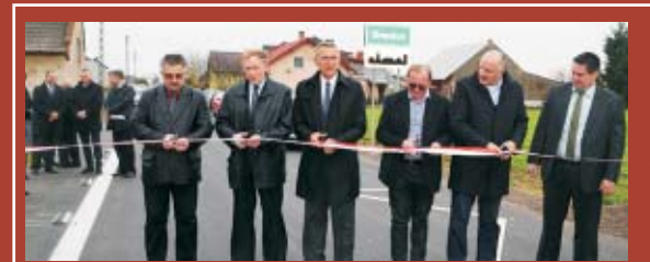
Modernizacja drogi w Smardzach zakończona. W dniu 30 października 2013 r. poprzez symboliczne przecięcie wstęgi, otwarto wyremontowaną drogę powiatową nr 5691P, która zmodernizowana została w ramach projektu „Modernizacja poprzez remont drogi powiatowej nr 5691P Granice - Smardze-Mroczeń z wydzielaniem ścieżki rowerowej. Etap III - miejscowość Smardze”.