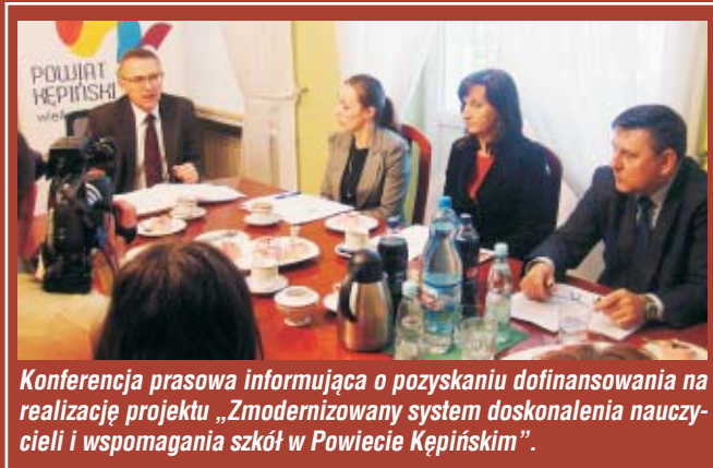
Konferencja prasowa informująca o pozyskaniu dofinansowania na realizację projektu „Zmodernizowany system doskonalenia nauczycieli i wspomagania szkół w Powiecie Kępińskim”.