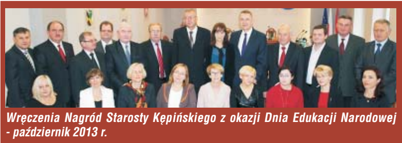
Wręczenia Nagród Starosty Kępińskiego z okazji Dnia Edukacji Narodowej - październik 2013 r.