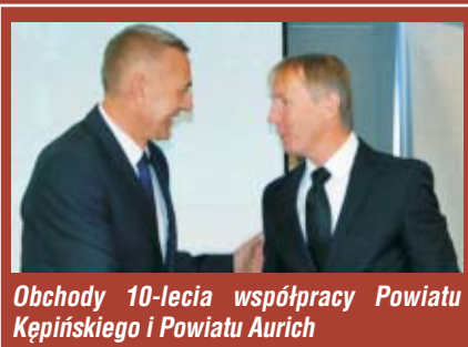
Obchody 10-lecia współpracy Powiatu Kępińskiego i Powiatu Aurich