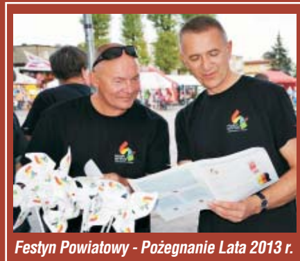
Festyn Powiatowy - Pożegnanie Lata 2013 r.