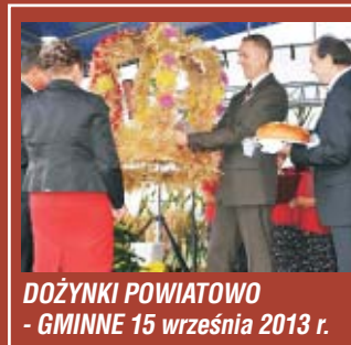
DOŻYŃKI POWIATOWO - GMINNE 15 września 2013 r.