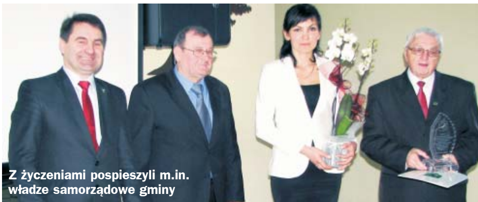
Z życzeniami pospieszyli m.in. władze samorządowe gminy