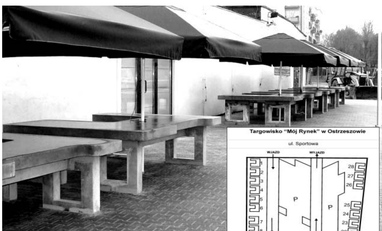
Targowisko "Mój Rynek" w Ostrzeszowie