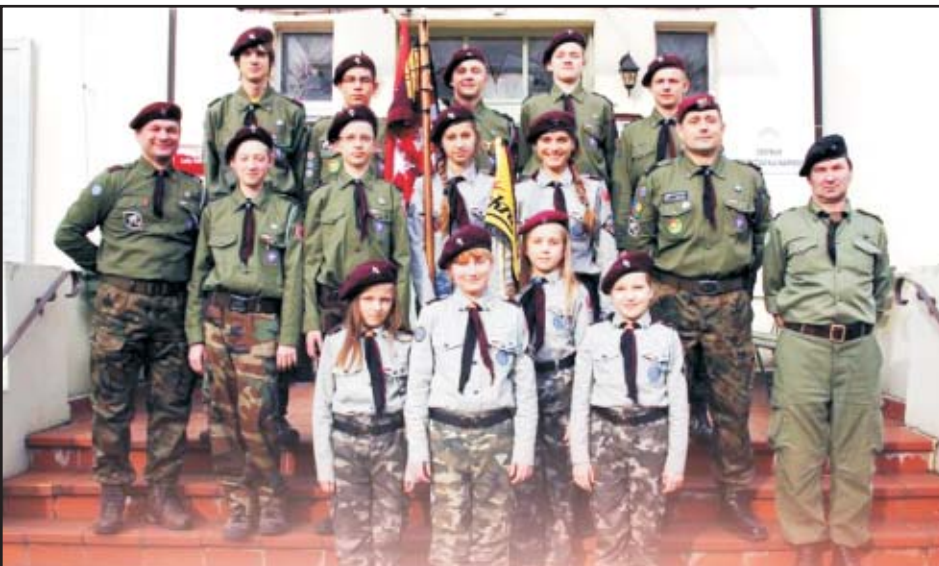
Ferie 3 DH z Mikstatu