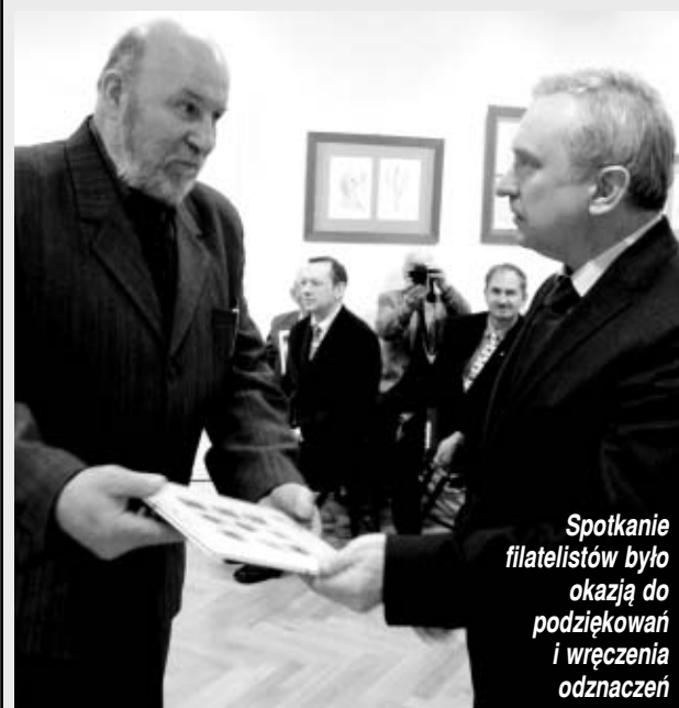
Spotkanie filatelistów było okazją do podziękowań i wręczenia odznaczeń