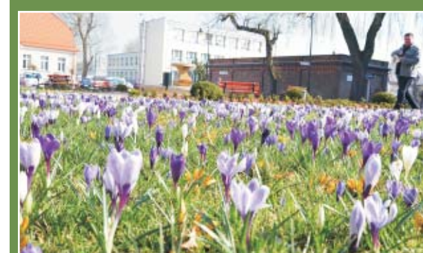
SKWER POCZTOWY W KĘPNIE