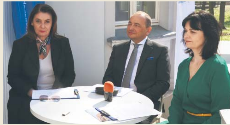
morząd kępiński realizował to w czasie przed pandemią - mówił burmistrz. Organizatorami tych wy-

- Świecące słońce przekonuje nas do tego, że trzeba zacząć organizować z powrotem imprezy plenerowe, imprezy zewnętrzne na większą skalę, tak jak sa-