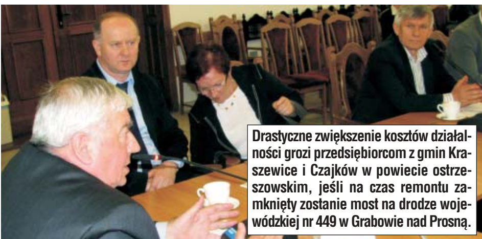
Drastyczne zwiększenie kosztów działalności grozi przedsiębiorcom z gmin Kraszewice i Czajków w powiecie ostrzeszowskim, jeśli na czas remontu zamknięty zostanie most na drodze wojewódzkiej nr 449 w Grabowie nad Prosną.