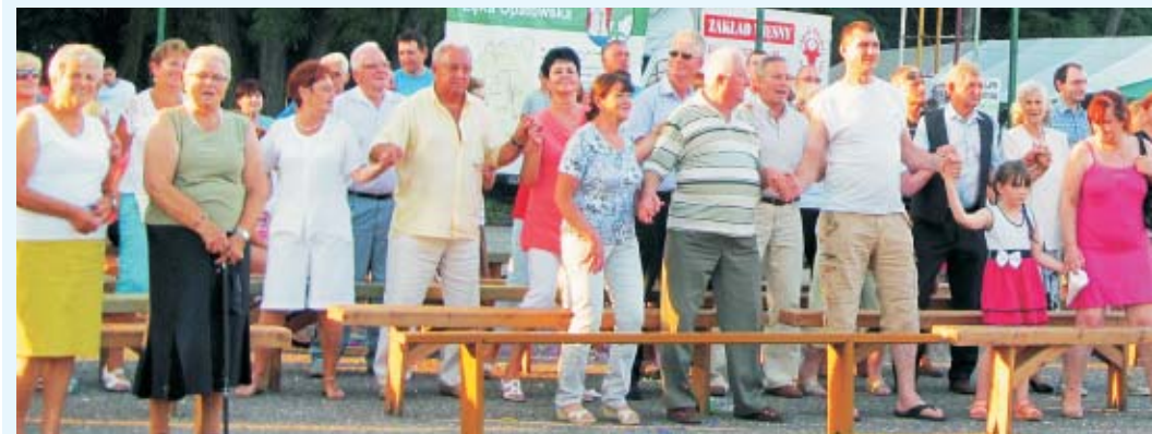
W miniony weekend swoje święto mieli mieszkańcy gminy Łęka Opatowska.