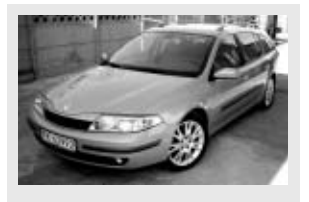
RENAULT LAGUNA 1.9DCI 122 KM, 12/2001 r., model 2002, błękitny metalik, pełne wyp., cena 6800. Tel. 691 795 628

1999 r., granatowy, przez 6 lat nieeksploatowany, spalanie 6,2 l, klima, ABS, 4 poduszki, 2 komplety kluczy z pilotami, halogeny, hak, alufelgi, stan idealny, sprowadzany z Niemiec, cena 5500 zł. Tel. 727 593 283