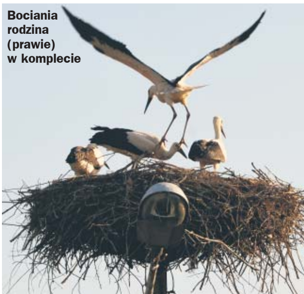
Bociania rodzina (prawie) w komplecie