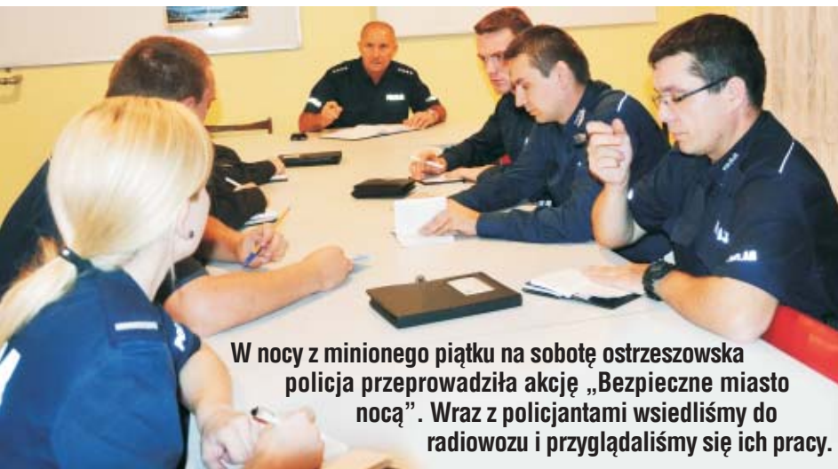
W nocy z minionej piątku na sobotę ostrzeszowska policja przeprowadziła akcję „Bezpieczne miasto nocą”. Wraz z policjantami wsiadliśmy do radiowozu i przyglądaliśmy się ich pracy.