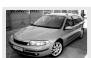
RENAULT LAGUNA 1.9DCI 122 KM, 12/2001 r., model 2002, błękitny metalik, pełne wyp., cena 6800. Tel. 691 795 628

Sprzedam Ford Escort, 1996 r., 1,8 TD, zarejestrowany, wiśnia metalic, klimatyzacja, cena 2200 zł. Tel. 692 669 010