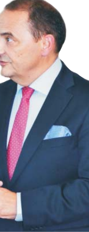
Pan nie odpowiada w tym liście konkretnie na nic.

A ja słyszę zgoda odmienne. Odnieść można wrażenie, że niezbyt poważnie traktuje Pan czytelników tego listu, bo