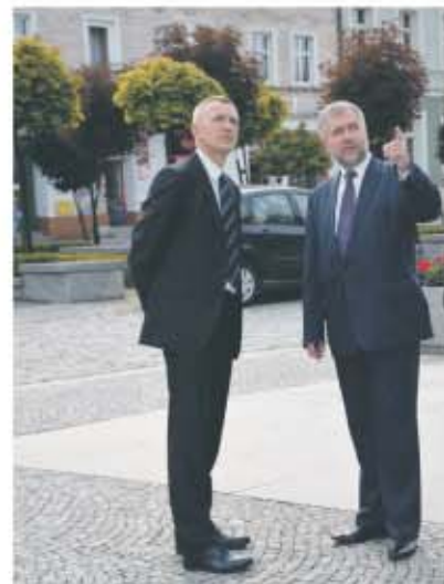
Starosta Włodzimierz Mazurkiewicz z Marszałkiem Województwa Wielkopolskiego Markiem Woźniakiem na kępińskim rynku.

WSPÓLNOTA SAMORZĄDOWA POWIATU KĘPIŃSKIEGO