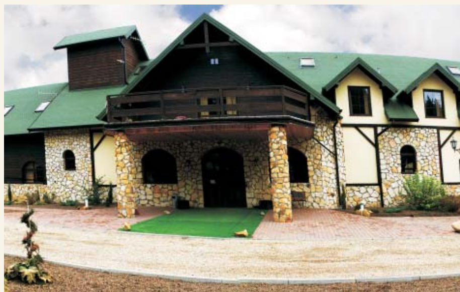
Ośrodek Szkoleniowo-Wypoczynkowy „Pascha” (Przedborów 1a, 63-510 Mikstat)