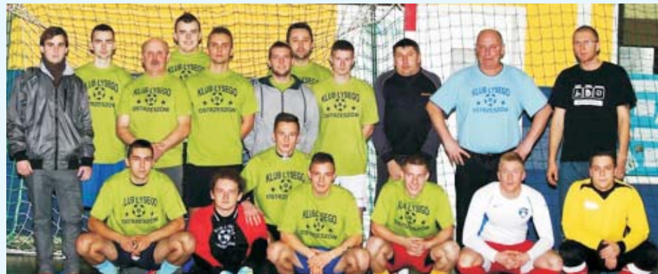
Kolejne mecze OHLPN już 20 grudnia. A w nich Klub Łysego podejmie Euros, a Nankatsu zagra z KS Rogaszycy.