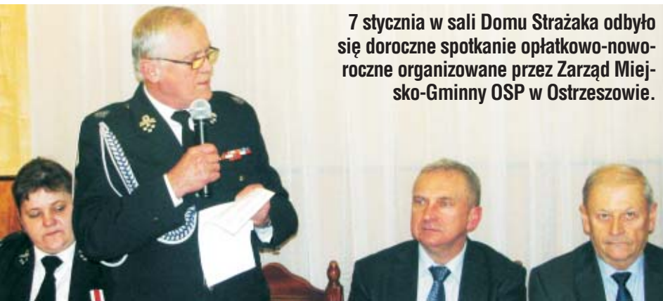
7 stycznia w sali Domu Strażaka odbyło się doroczne spotkanie opłatkowo-noworoczne organizowane przez Zarząd Miejsko-Gminny OSP w Ostrzeszowie.

Ochotnicze straże pożarne są służbami cieszącymi się chyba największym zaufaniem wśród społeczeństwa i chyba najliczniejszymi stowarzyszeniami działającymi