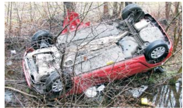
Dzień później niemal w tym samym miejscu wypadł z drogi i dachował w rowie jadący renault clio mężczyzna