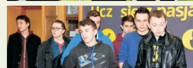
okazał się zespół z Gimnazjum w Bralinie.