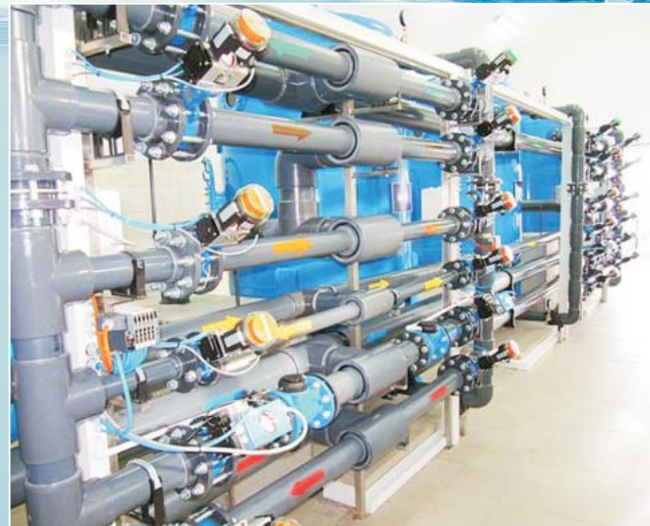
Stacja pomp II st. ul. Słoneczna po modernizacji ze środków FS 11.2010 r.