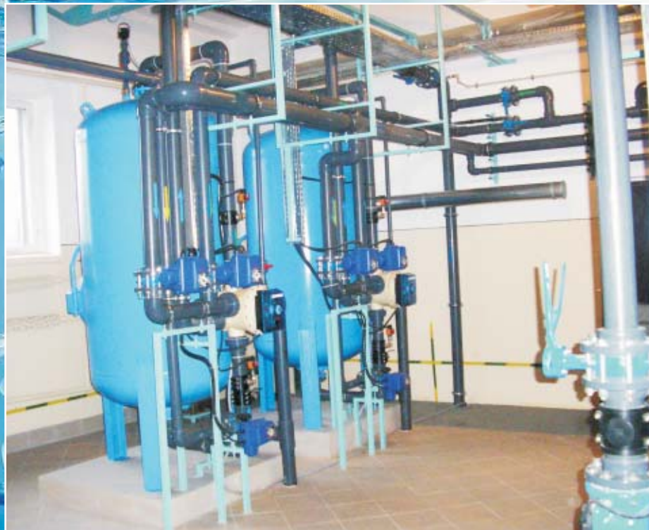
Zmodernizowana ze środków Funduszu Spójności SUW Grębanin