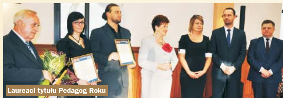
Laureaci tytułu Pedagog Roku