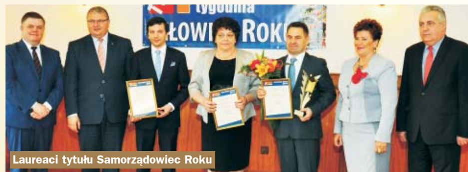
Laureaci tytułu Samorządowiec Roku