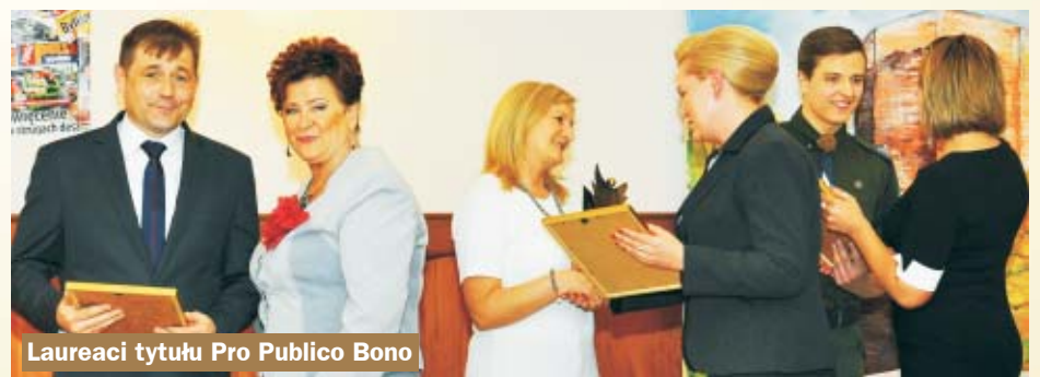
Laureaci tytułu Pro Publico Bono