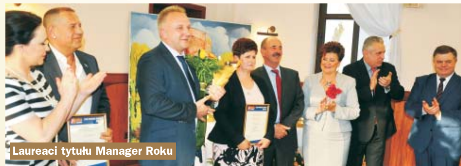
Laureaci tytułu Manager Roku

- Jestem bardzo zaskoczony i wzruszony - nie ukrywał.