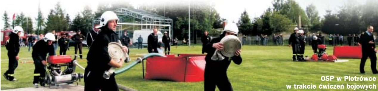
OSP w Piotrówce w trakcie ćwiczeń bojowych

nie ciepłego posiłku, który wszystkim bardzo smakował. RED